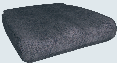
Curera® Tremix med standardöverdrag

Curera® Tremix har ett vätsketätt ytskikt som inte släpper igenom vätskor samt är lätt att rengöra. Med dynan följer ett slitstarkt överdrag av grå polyesterplysch med god friktion. Samtliga Curera® sittdynor och överdrag innehåller inte några bromerade flamskyddsmedel eller latex.