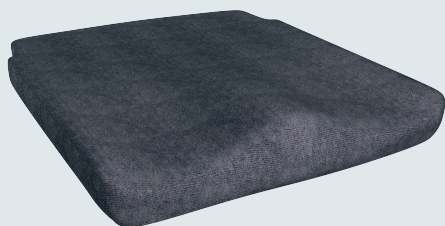
Curera® Consept Sittdyna med standardöverdrag

Den anatomiska och anpassade formen fördelar trycket mot lårens undersida, ger en bra sittposition, god avlastning för sittbensknölar och svanskota samt minskad risk för skjuvkrafter. Med urtag för ryggör och rundad bakkant ger den även en bra passform i rullstolen. Komforten hos Curera® Consept är god och passar personer som sitter både längre och kortare tid. Curera® Consept kan användas i både rullstolar med plansits och hängmattesits.