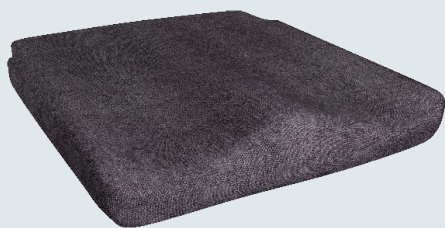
Curera® Consept Sittdyna med standardöverdrag

Den anatomiska och anpassade formen fördelar trycket mot lårens undersida, ger en bra sittposition, god avlastning för sittbensknölar och svanskota samt minskad risk för skjuvkrafter. Med urtag för ryggör och rundad bakkant ger den även en bra passform i rullstolen. Komforten hos Curera® Consept är god och passar personer som sitter både längre och kortare tid. Curera® Consept kan användas i både rullstolar med plansits och hängmattesits.