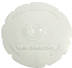
Centrumhål 0 mm

Alla storlekar går att beställa med 3 olika mått på centrumhål: 0/80/120 mm