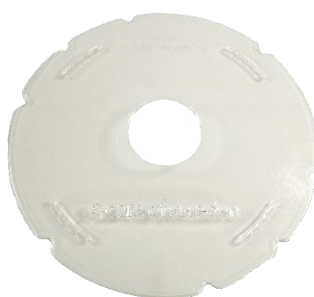
Centrumhål 120 mm