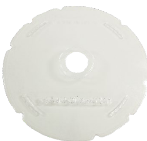
Centrumhål 80 mm