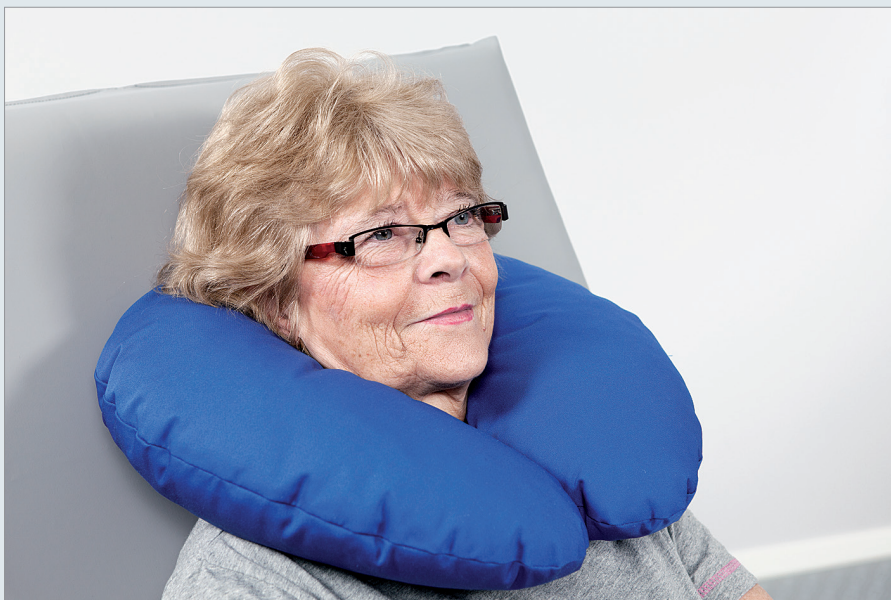
TRYCKAVLASTNING, STÖD OCH POSITIONERING HUVUD/NACKE.