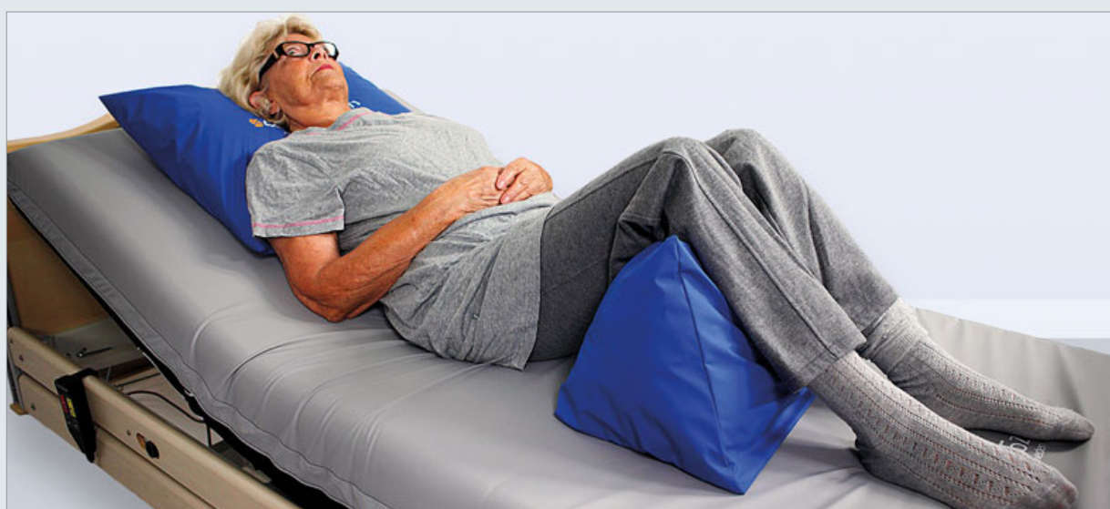
EXEMPEL PÅ POSITIONERING

Curera® Trekantskudde placeras under knäna, minskar skjuvkrafter i sittande position och skapar viloläge i liggande. Trekantskudden kan också placeras som en ryggstöds kudde bakom brukarens rygg.