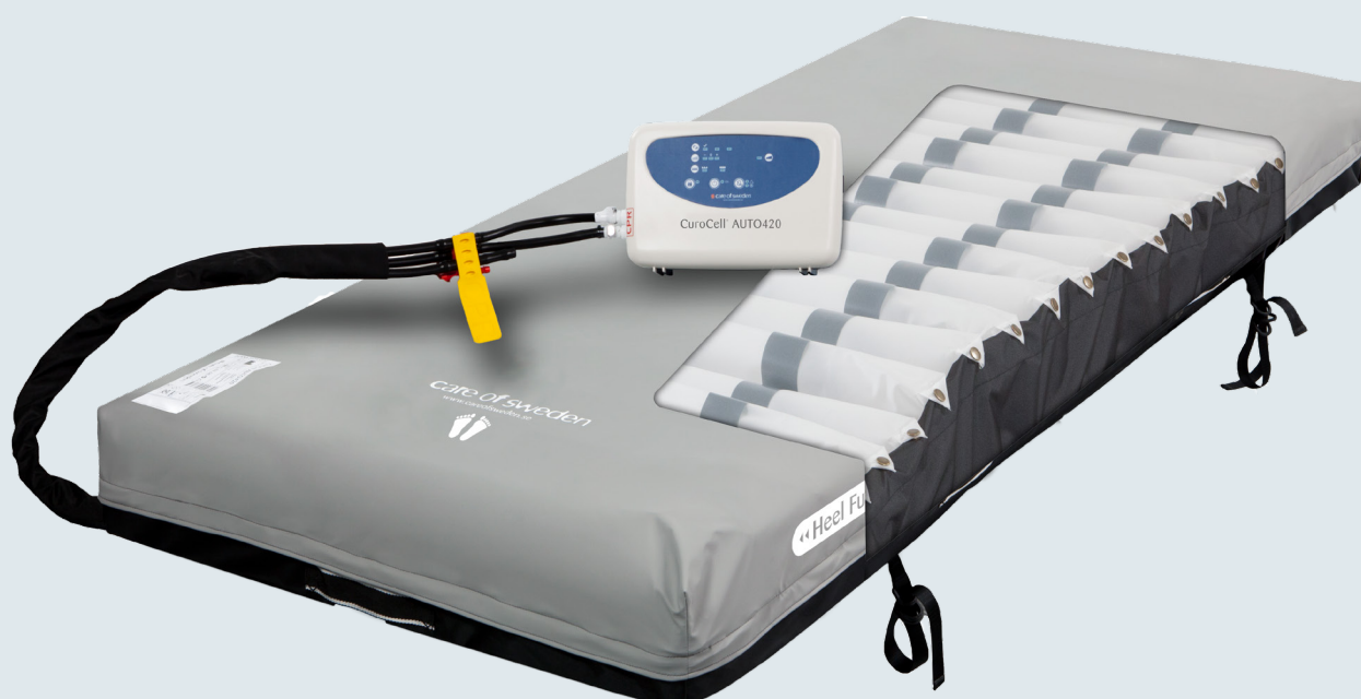
CuroCell AUTO420 med överdrag Olivia/U-del CC

Självinställande madrasssystem med hög användbarhet