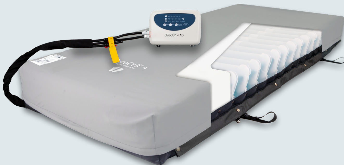
CuroCell 4 AD med Toppdel Olivia/U-del CC