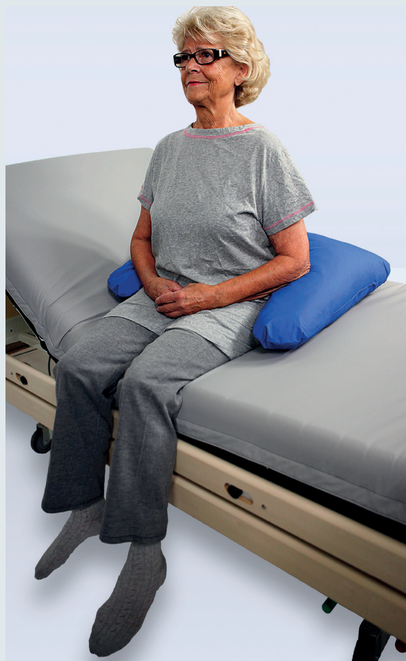
EXEMPEL PÅ POSITIONERING

Att arbeta med Curera® Positionering är enkelt. Kontakta Care of Sweden för utbildning och mer information.