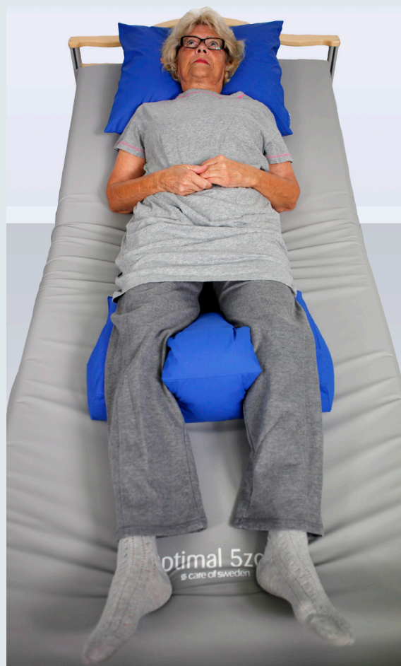
EXEMPEL PÅ POSITIONERING

Att arbeta med Curera® Positionering är enkelt. Kontakta Care of Sweden för utbildning och mer information.